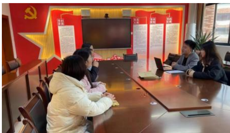
图 企开展学术 交 会