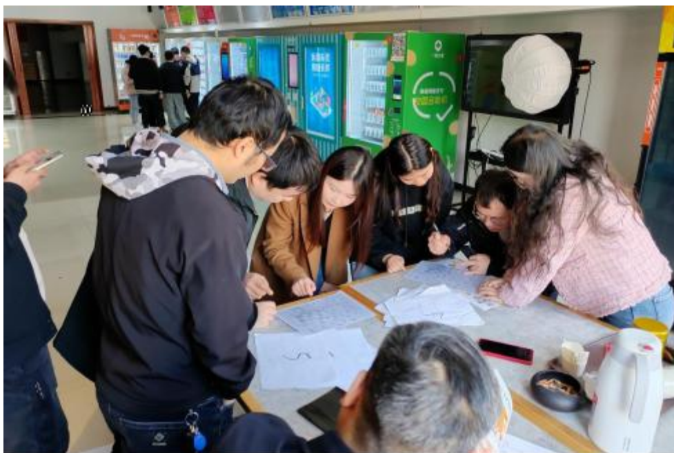
图 卓 团 建 共