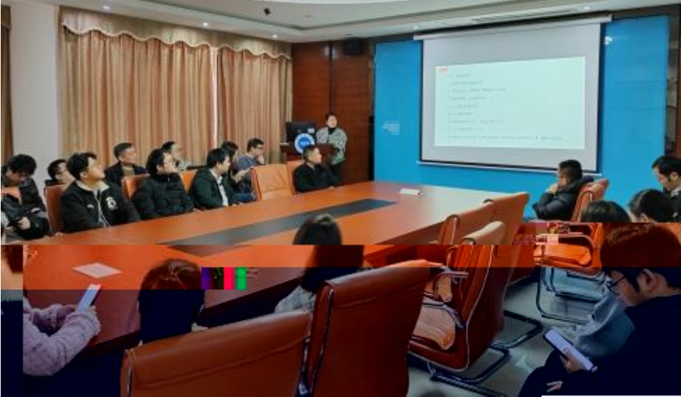
图 员工专业技 培